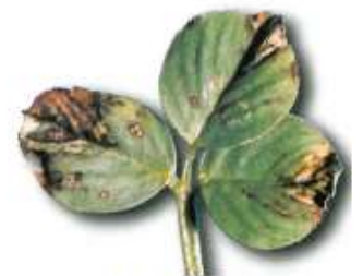
Symptômes foliaires du pepper-spot.

Gestion du risque : la coupe précoce est la seule méthode de lutte.