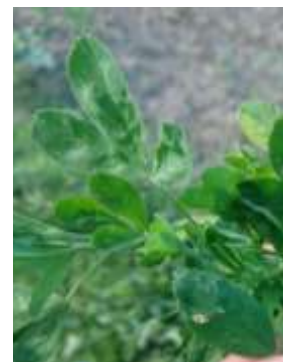
Symptômes de LEV et momie de puceron

Observation : Bien que toutes les plantes présentent des symptômes du virus, l'intensité de celui-ci n'influence pas la récolte, pour le moment.