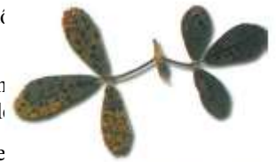
Taches de pseudopeziza sur feuille.